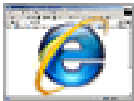
Internet Explorer 7 (Windows Vista標準搭載)