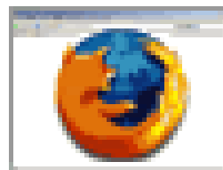
Mozilla Firefox 3.0.5